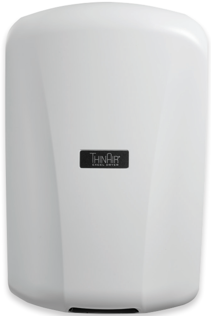
TA-ABS Polímero Blanco (ABS) Con Aditivo Antimicrobiano SanaFor™